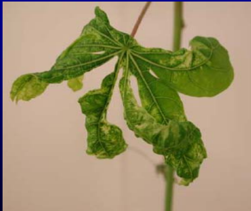
African cassava mosaic virus