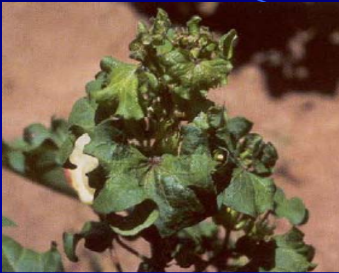
Cotton leaf curl virus